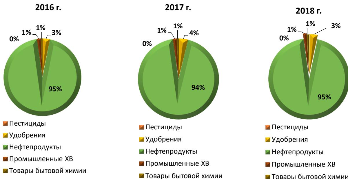
Рисунок 2.А: Производство химических веществ в 2016-2018 гг.

На предприятиях республики используется широкий спектр химических веществ (кислоты и щелочи, растворители, красители и др.). Значительное количество химических веществ ввозится в Республику Казахстан, это – бензин, средства защиты растений и промышленные химикаты. В течение 2016-2018 гг. этот тренд сохранялся, лишь в 2018 году импорт нефтепродуктов сократился в некоторой степени при небольшом росте импорта удобрений и товаров бытовой химии. Эти данные представлены на рисунке 2.В.